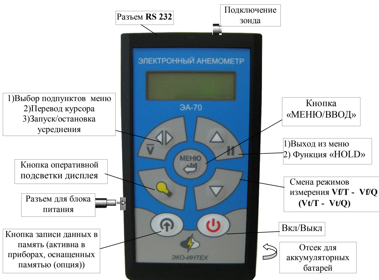
Рис. 5.1 Электронный анемометр ЭА-70 (1)

5.2.2 Анемометр модель ЭА-70(1) смонтирован в пластмассовом корпусе (рис. 5.1), на лицевой панели которого размещены выключатель прибора, ЖК индикатор и кнопки управления. На верхней стороне корпуса расположены: разъем RS-232 для подключения ПЭВМ, разъем для подключения зондов для измерения скорости (тип зонда по заказу). Разъем для подключения внешнего блока питания расположен на левой боковой стороне корпуса. На задней панели расположен отсек для аккумуляторных батарей с открывающейся крышкой. Микропроцессор находится внутри измерительного блока.