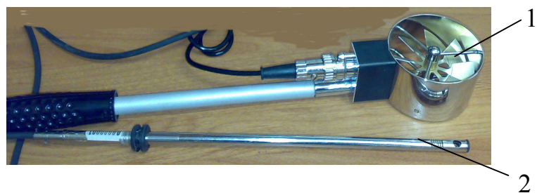
Рис. 5.2. Зонды к ЭА-70: 1 – зонд-крыльчатка, 2 – зонд «обогреваемая струна».

5.2.4 Прибор в комплекте упаковывается в пластиковый кейс.